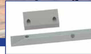
Melder & Kontakte

Zur Scharf-Unscharfschaltung der Anlage werden spezielle berührungslos arbeitende Leser eingesetzt. Eine Bedienung ist mit entsprechendem Schlüsselanhänger oder Karte möglich, wahlweise in Kombination mit zusätzlicher Codeeingabe oder Ihrem Fingerabdruck. Mit einem Sperrelement wird das unbeabsichtigte Betreten des scharfgeschalteten Bereichs verhindert. Gleichzeitig wird dokumentiert wer wann die Anlage aktiviert hat. Zusätzlich kann in Verbindung mit der Einbruchmeldeanlage eine Zutrittskontrolle realisiert werden.